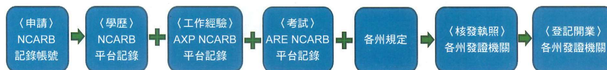
美國建築師執照取得流程示意